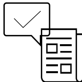
Votes aux assemblées